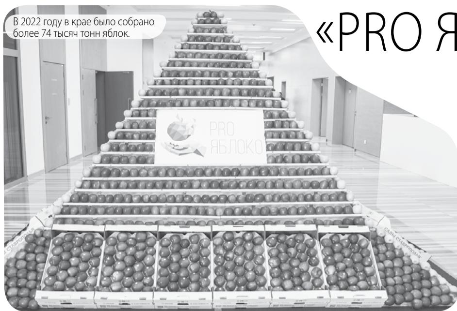
В 2022 году в крае было собрано более 74 тысяч тонн яблок.